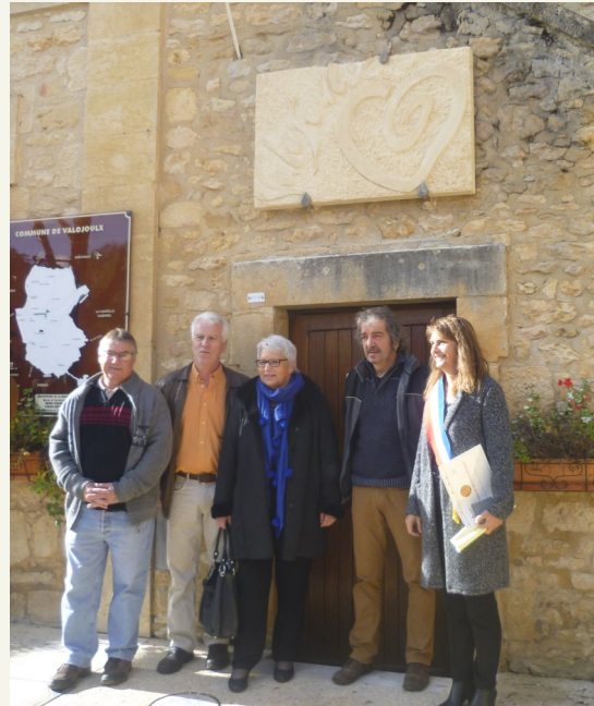
Cérémonie don du sang 11.11.2016