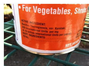
Insecticide biologique - Bacillus thuringiensis var. kurstaki

Dès les premiers signes de l'attaque de pyrale ou en préventif, dès le mois de mars, on peut pulvériser sur le feuillage un insecticide biologique à base de Bacillus thuringiensis ssp kurstaki (Btk) : cette bactérie sera ingérée par les chenilles et provoquera leur mort en quelques heures. Il faut cependant bien pulvériser l'ensemble du feuillage (dessus et revers des feuilles), et renouveler le traitement 10 jours après, ou en cas de pluie.