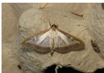
Papillon de pyrale du buis – Cydalima perspectalis

Les vols de papillons de pyrale du buis s'observent entre juin et octobre . 2 à 3 générations se succèdent dans l'année, avec des pics de vols (et donc de pontes) en juin/juillet , puis en septembre . Cependant, c'est dès le mois de mars que les attaques de chenilles ont lieu , car la dernière génération passe l'hiver dans des cocons, sur la plante, et les chenilles en émergent en mars : les dégâts s'observent donc dès le début du printemps.